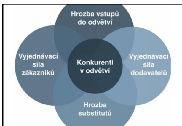
Obrázek 1 Porterův model pěti sil